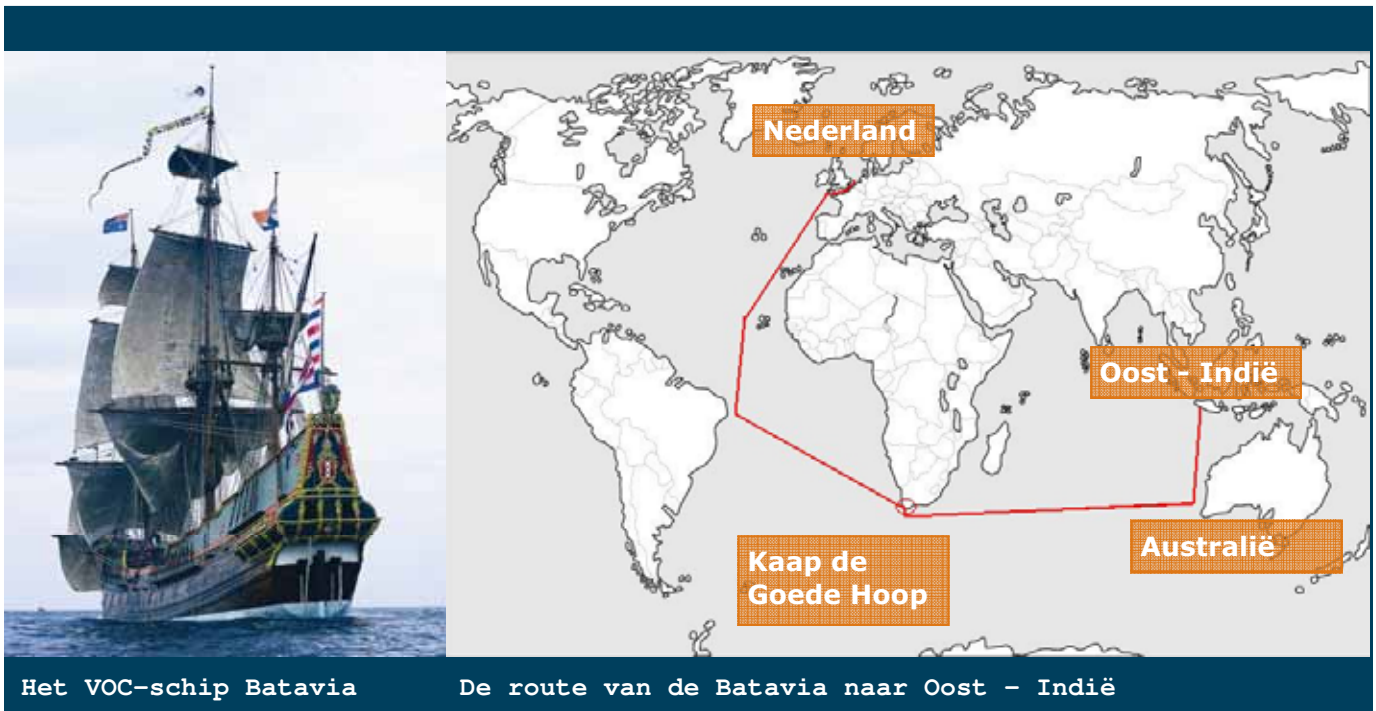
Het VOC-schip Batavia

In het jaar 1628 vertrok in oktober vanaf Texel een vloot van zeven VOC-schepen naar Oost-Indië. Een van die schepen is de net nieuwgebouwde Batavia, genoemd naar de hoofdstad van Java. De Batavia is een retourschip. Dat betekent dat het schip heen en weer vaart tussen Nederland en Azië om mensen en goederen te brengen en te halen.